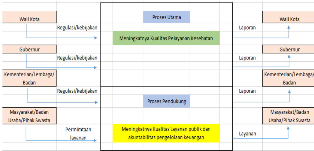
Gambar.... Peta Proses Bisnis Dinas Kesehatan Kota Tasikmalaya

kepada Wali Kota. Proses penyelenggaraan urusan bidang kesehatan dapat dilihat pada gamabar di bawah ini.